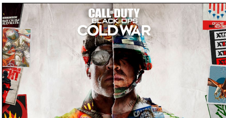
Call of Duty: Black Ops Cold War, desenvolvido pela Activision e com a parceria da Kokku

São Paulo, 19 de maio de 2022 – A participação brasileira no cenário internacional de games vem crescendo a cada ano, seja em consumo, número de jogadores ou no desenvolvimento e produção de jogos. Maior mercado de games da América Latina, a expectativa é que o país tenha movimentado US$ 2,3